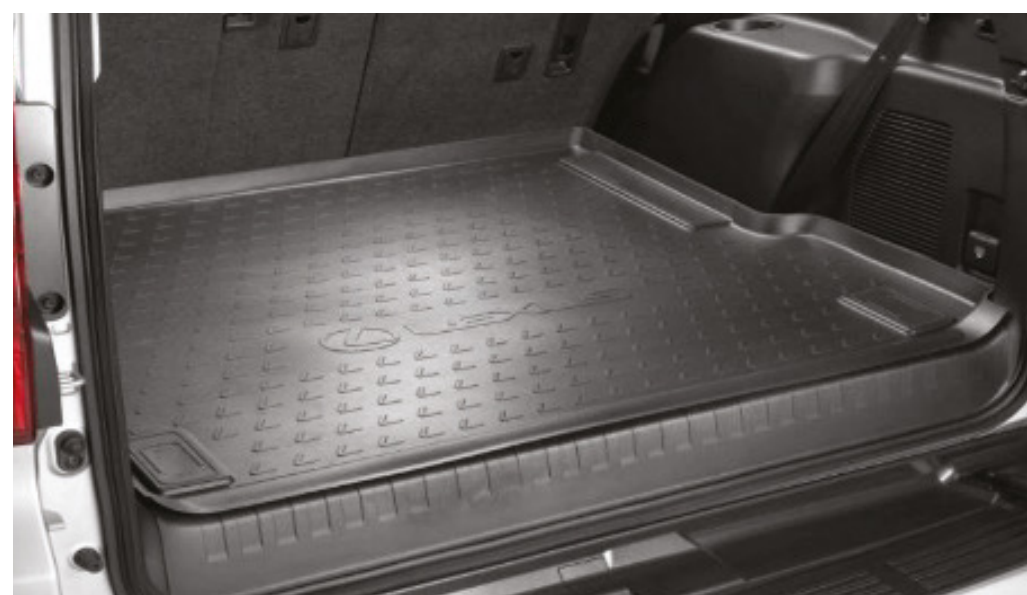
Піддон багажного відділення, гумовий