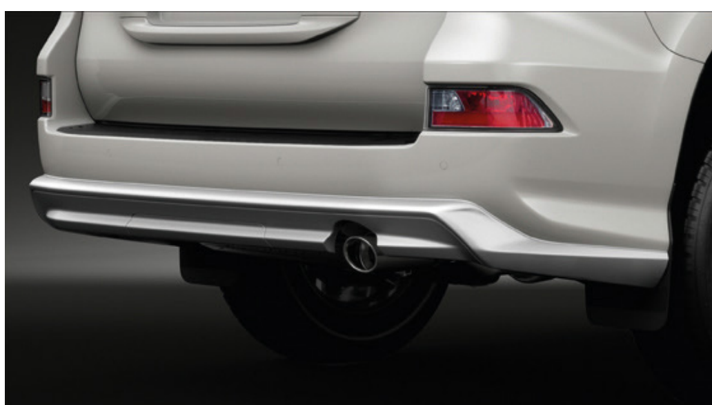
Наконечник вихлопної труби