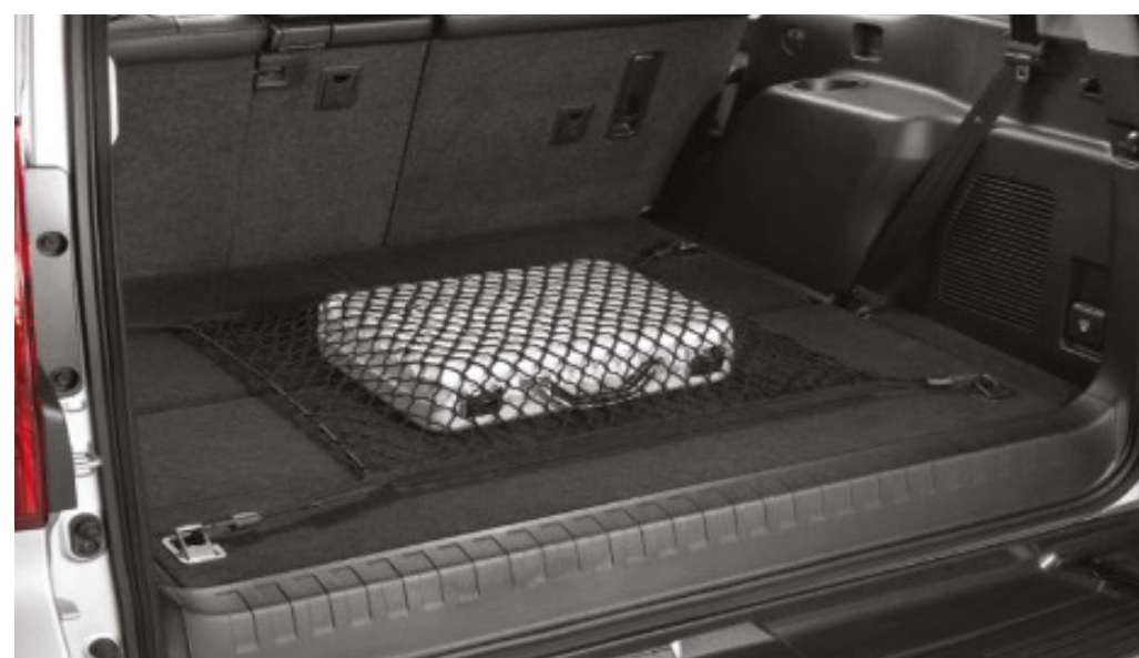
Горизонтальна вантажна сітка