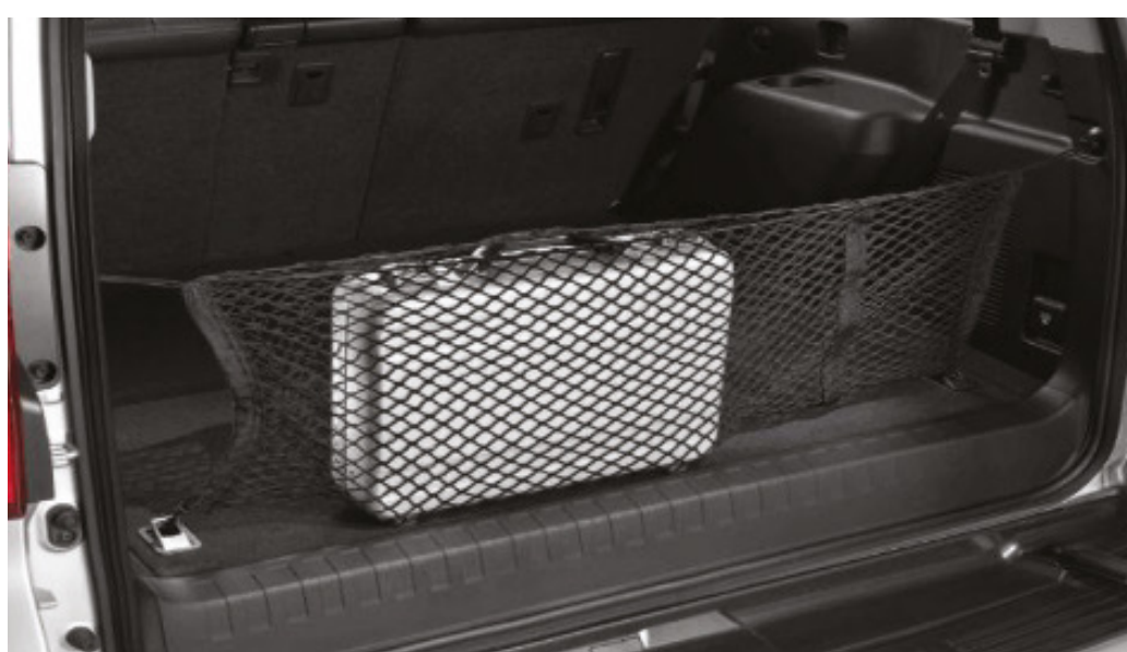
Вертикальна вантажна сітка