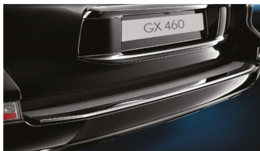
Захисна пластина заднього бампера