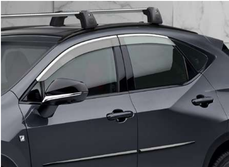
Дефлектори вікон з хромованим окантуванням