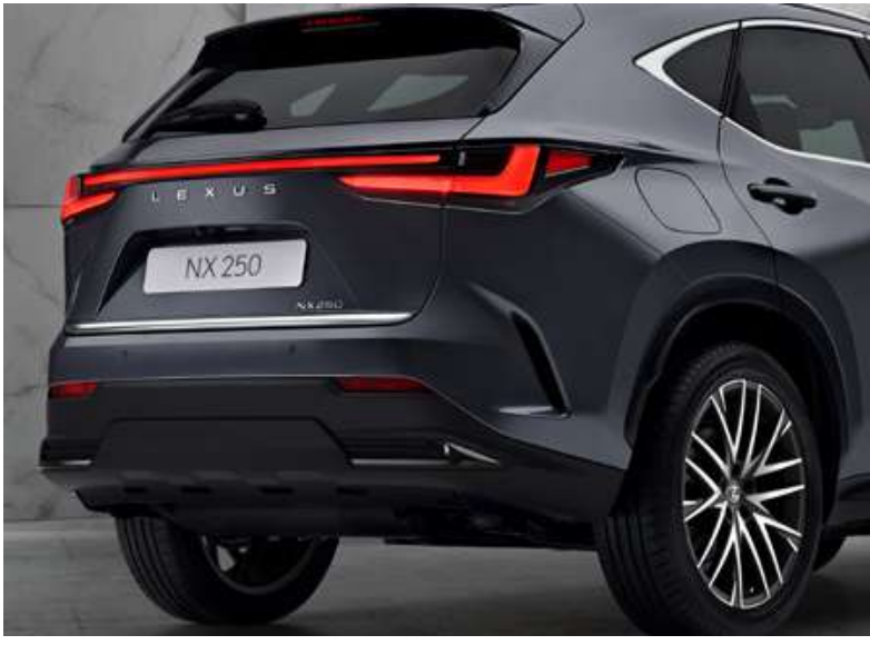
Декоративна накладка дверей багажника