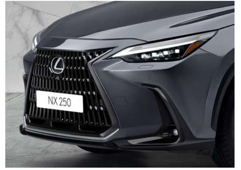
декоративна накладка переднього бамперу