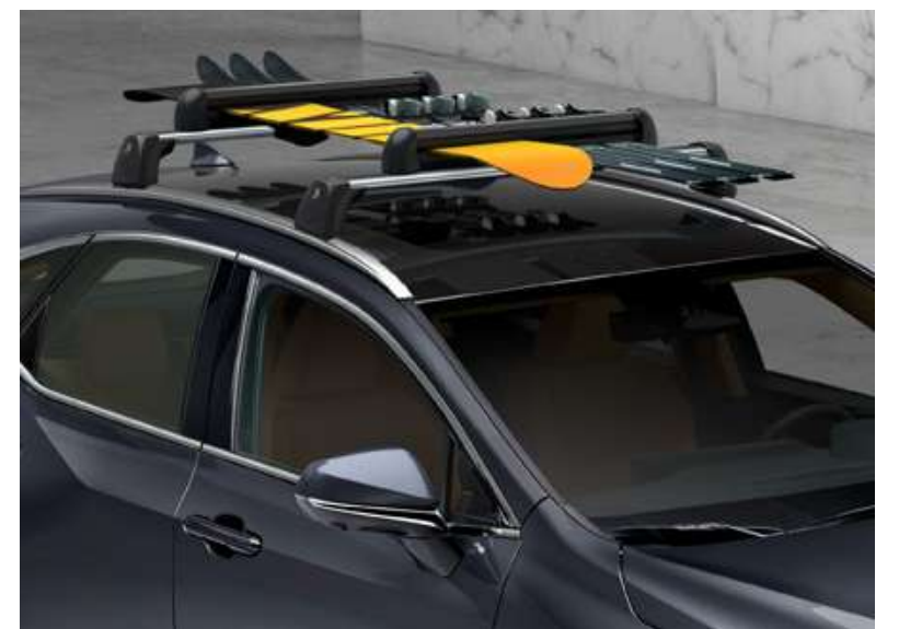
Поперечини даху та кріплення для лиж та сноуборду