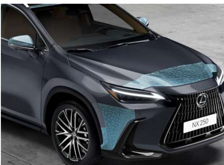
Комплект захисних плівок кузова