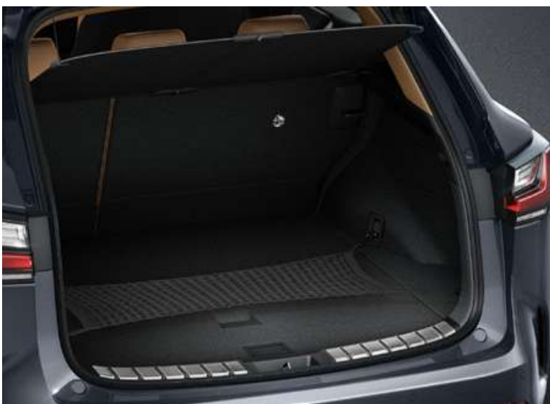
Сітка для багажника горизонтальна