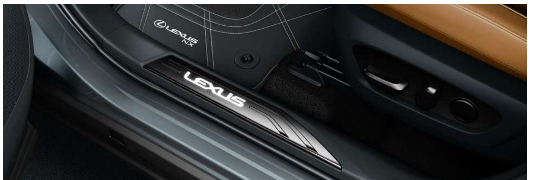
Накладки порогів з підсвіткою