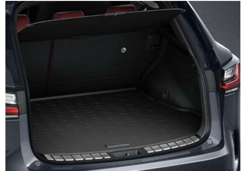
Гумовий піддон багажника