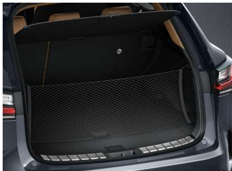
Сітка для багажника вертикальна